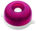
МАЯК-12-КП, МАЯК-24-КП оповещатель комбинированный